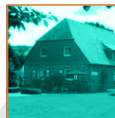
Haus der Jugend