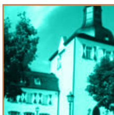
Museum der Stadt